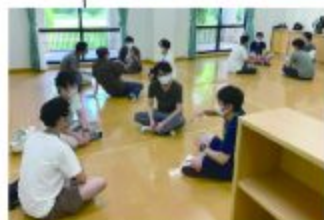
▲さぼさぼ「バートークプログラム」の様子