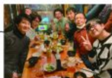
▲littleみやっこバートークメンバー

関西学院子どもセンターのさぼさぼ(地域の子ども・子育て支援事業)では、お父さんたちが集い、子育てや自分のことを語り合う「バートークプログラム」を毎年7月から3回の連続プログラムとして実施しています。バートークでは、お父さんたちが普段の話を聞いて語り合い、自分自身のこと、子育てやパートナーとの関係を共に建設的に見つめる「コミュニティづくり」を目指しています。そのような安全なつながりは、お父さん自身を、またその子育てを豊かにしてくれるはずですよ。