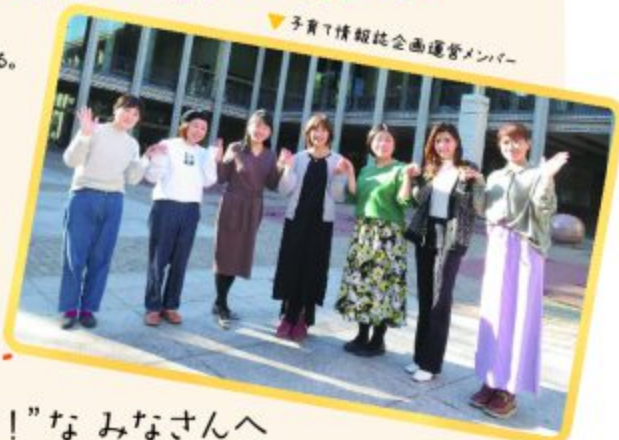
▼子育て情報誌企画運営メンバー